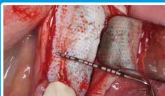
6 maanden later wordt de Cytoplast-Titanium membraan verwijderd