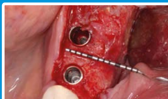
Het plaatsen van 2 implantaten is nu goed mogelijk